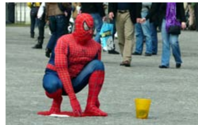
Begabungen entdecken