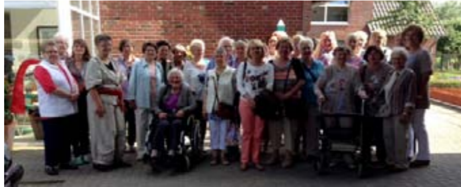
kfd-Frauen auf dem Feuler Hof