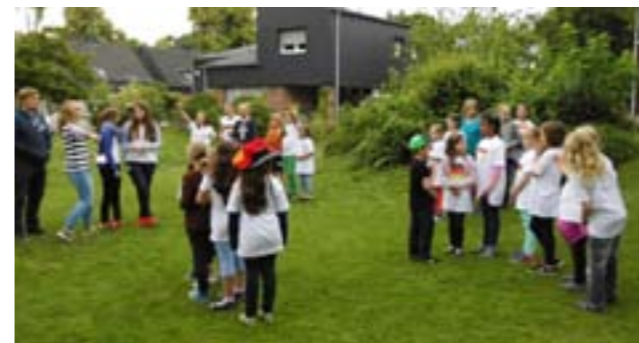
Spaß und Spiel im Pfarrgarten

Für 36 Kinder begann am Samstagnachmittag (21.6.2014) mit dem Aufbau der Zelte ein kleines Abenteuer. Der Disteln-Treff hatte zum Sommerfest rund um das Pfarrzentrum St. Josef Disteln eingeladen. Gemeinsam mit den Eltern und Betreuern wurde ein kleines Zeltdorf errichtet, bei dem natürlich die Deutschlandfarben nicht fehlen durften. Für alle Teilnehmer gab es Würstchen vom Grill und Getränke. Die Eltern der Kommunionkinder bekamen auch noch eine DVD mit Bildern von der Erstkommunionfeier als Andenken vom Disteln-Treff geschenkt.