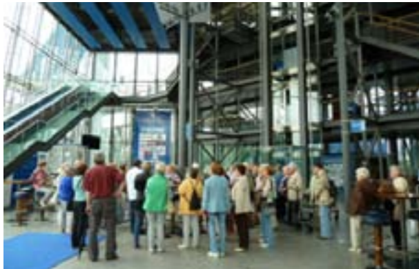
Ausflug „Auf Schalke“

älteren Frauen gut bewältigt wurde, beeindruckten uns die großen Glasfassaden mit Abbildungen verschiedener Fußballspieler. Die überlebensgroßen Bilder setzen sich aus vielen kleinen Fan-Portraits zusammen. Außerdem konnten wir einen Blick auf die ausgefahrene Rasenfläche werfen, die je nach Bedarf in 3,5 bis 4 Stunden nach innen verschoben werden kann. Für diesen Vorgang muss die komplette Südtribüne angehoben und verschoben werden, wodurch die Arena sowohl für sportliche als auch für kulturelle Veranstaltungen optimal genutzt werden kann. Das verschließbare Dach gewährleistet außerdem Wetterunabhängigkeit. Durch die steil ansteigenden Sitzreihen ist gute Sicht vorprogrammiert und der große Videowürfel über dem Spielfeld trägt ebenso dazu bei. Im Zuschauerraum finden je nach Veranstaltung bis zu 78.000 Menschen Platz.