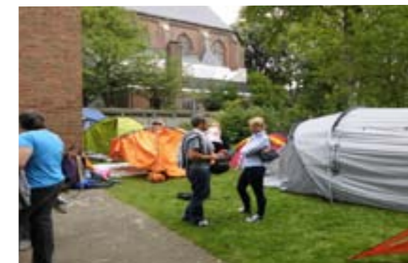
Aufbau der Zeltstadt