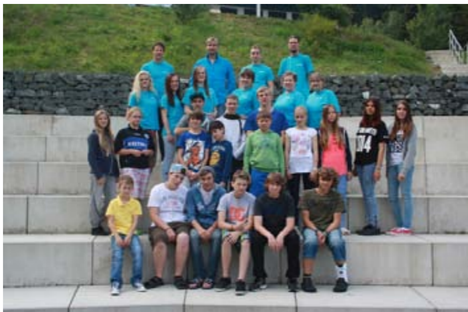
Kinder und Betreuer des Ferienlagers St. Joseph Süd