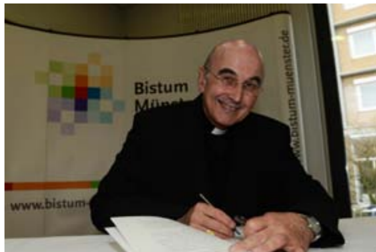
Bischof Felix Genn

So lautet die Zielvorgabe des Diözesanpastoralplans für das Bistum Münster. Viele Engagierte haben in Arbeitsgruppen, Gremien und Räten an der Entstehung mitgewirkt. Bischof Felix Genn äußerte deshalb bei der Unterzeichnung im März 2013 die Hoffnung, dass „das Papier nicht nur ein Papier bleibt!“ Er lud die Pfarreien ein, nun aktiv mit diesem Plan zu arbeiten und ihn für sich zu konkretisieren.