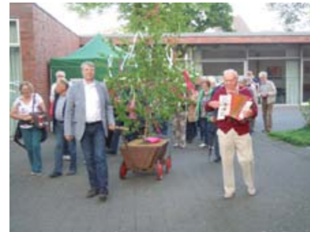
Maigang mit Bollerwagen