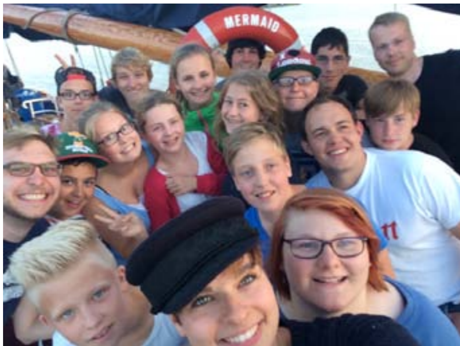
Die Crew der Mermaid für eine Woche

„Die Fahrt startete am Samstag pünktlich um 9.30 Uhr vom Kaplan-Prassek-Heim Richtung Harlin-