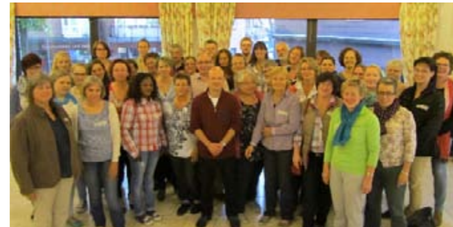
Mitglieder des fusionierten Chores

Die Chormitglieder verabredeten, nach den Sommerferien regelmäßig in Westerholt im Pfarrzentrum St. Martinus zu proben, dafür aber den Montag zum gemeinsamen Probenstag zu erklären. Beide Chöre waren damit einverstanden und so knüpften wir kurz vor Beginn der Sommerferien bei einem gemeinsamen Grillabend in Westerholt erste Kontakte.