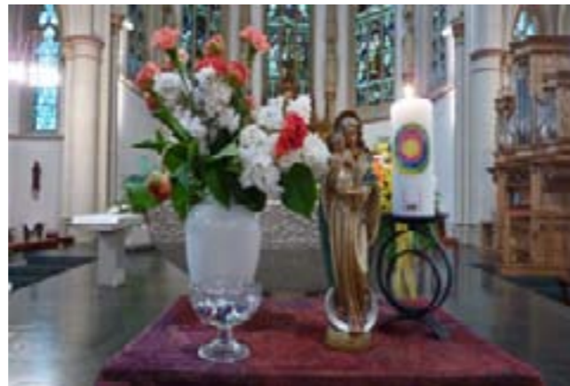
Maiandacht in St. Josef Disteln